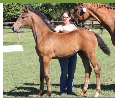
DJERBEL DE LOMBUT