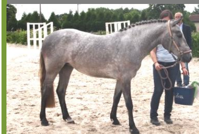
BLACK PEARL D'EILIDH