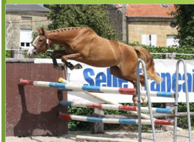
BALZA DE TOSCANE

Salon du Cheval de Paris du 30 novembre au 8 décembre