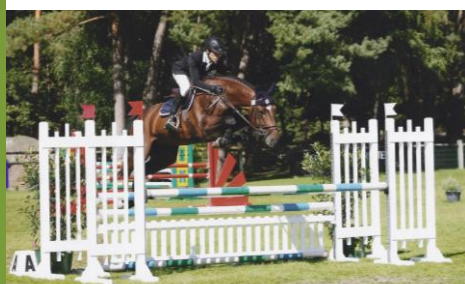
ELITE : VOLNAY DU BOISDEVILLE