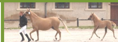
GRACIELLA DB & DAKODAK D'EMERY

Dans la même épreuve à Talma, on retrouve un foal de Canturo x Karla de Toscane x Quidam de Revel, né à la SCEA du Vieux Noyer (51) qui est 1er avec 7,7. La 2ème place est convoitée par DICAPRIO D'ASSCHAUT (Vigo Cece x El Gouna Blessée Van't Asschaut), présenté par Mme MUYS (Belgique), qui obtient la note globale de 7,6.