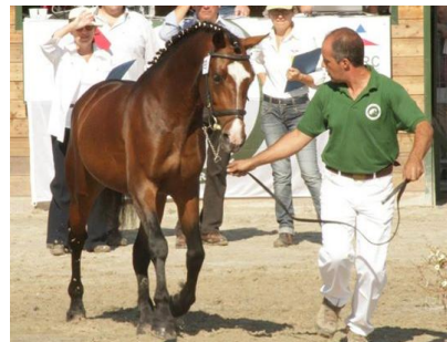
VERY GOOD DU VENT