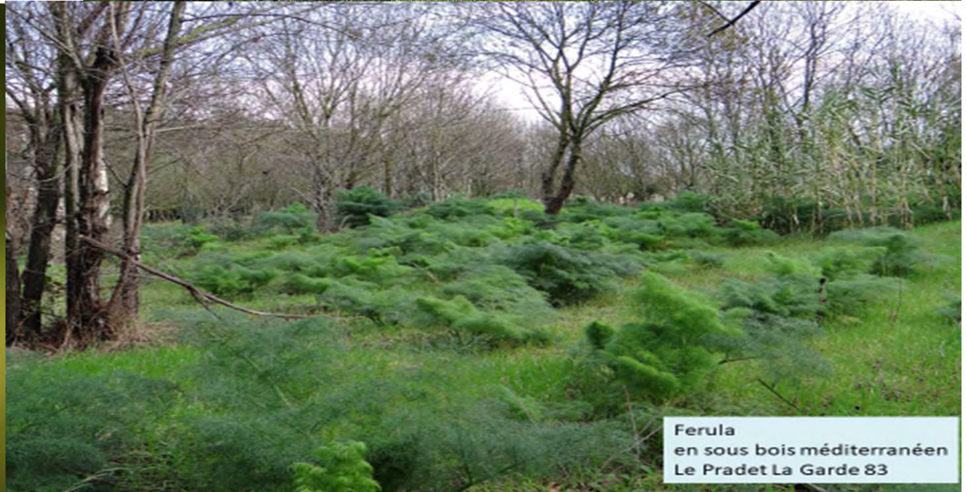
Ferula en sous bois méditerranéen Le Pradet La Garde 83