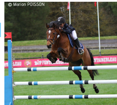
COME GIRL DU ROND PRE